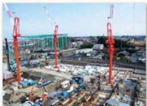
工事現場の全景（屋上より）