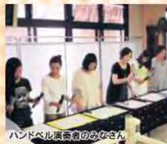
ハンドベル演奏者のみなさん