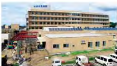
■本館南側外観(外構工事が進められています)