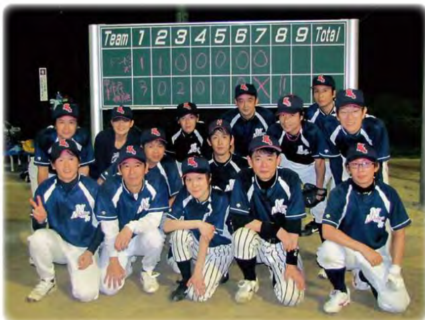
中津市民病院 野球部