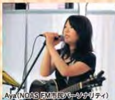
Aya (NOAS FM市民ホールサリテイ)