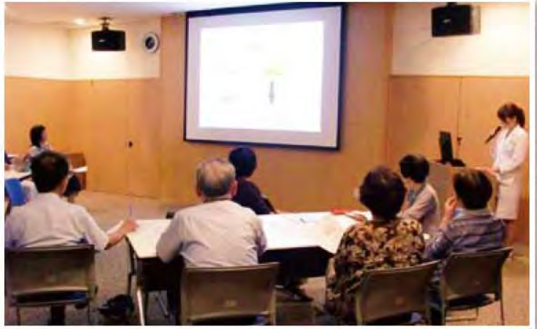
9月のがんサロンの様子

「交流会」では、体験された方にしか分らない話が出され、最近では、患者さんやご家族が少しずつ繋がり、支えあいの場になってきています。