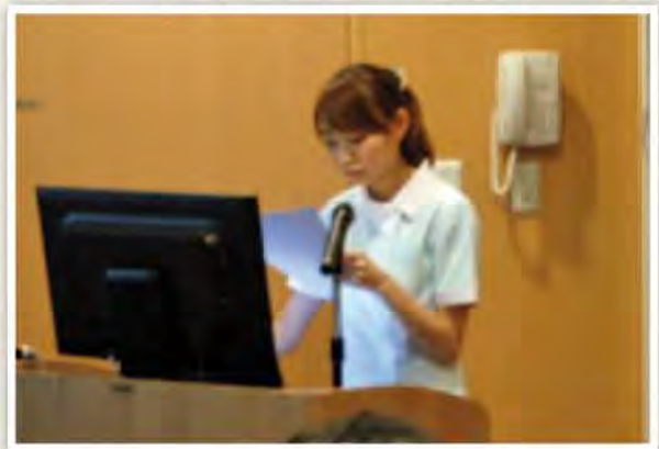
手術に対し不安の強い患者様との関わり -術前訪問を行い不安の軽減に努めるために-