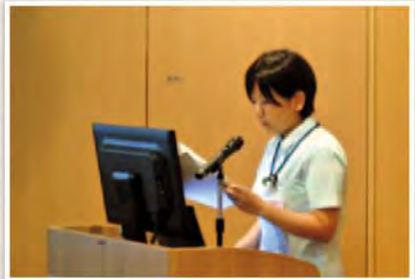
子宮広汎全摘術後の化学療法に対する精神面への看護 -術後化学療法を行う患者の心理-

行った看護を論理的に分析することや、理論にもとづいて展開することを学び看護観を深め、次の看護に活かすことを目的としています。