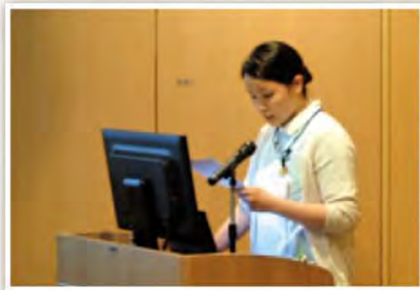
I型糖尿病を告知された患者への精神的ケアの重要性 -インシュリン療法の指導を通して-