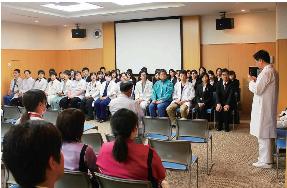
是永院長が新任医師の皆様へ激励の言葉を述べられている様子