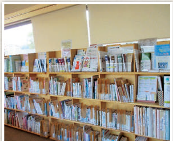
宇佐市民図書館 医療・健康情報コーナー