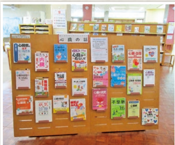
「心臓の話」コーナー