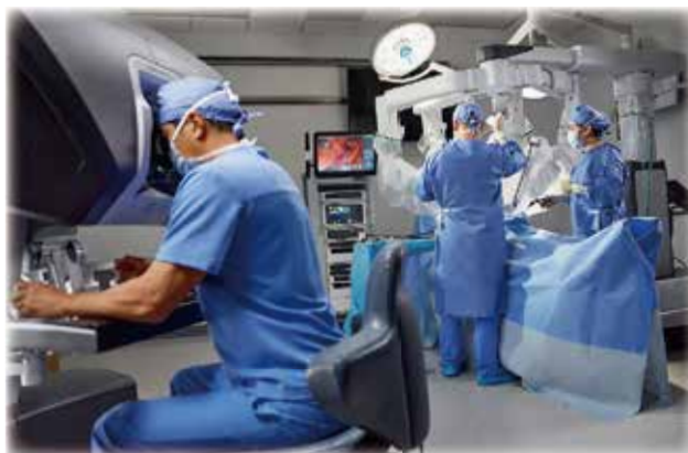
手術風景イメージ