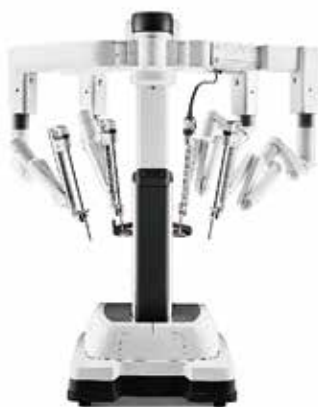
ダ・ヴィンチXiL ペイシェントカート

2025年2月からの運用に向けて、当院では外科医、麻酔医、手術に携わるスタッフが安全に手術を行うための準備を進めています。ロボット支援手術は、直腸がんの手術から開始し、その後に他のがんにも適応を広げる予定です。これらのがんに対する手術は保険収載されており、通常の保険診療で手術を受けることが可能です。市民の皆さんにより良い、安全で質の高い医療を受けてもらえるように励んでいます。詳細につきましては外科の担当医にお問い合わせください。